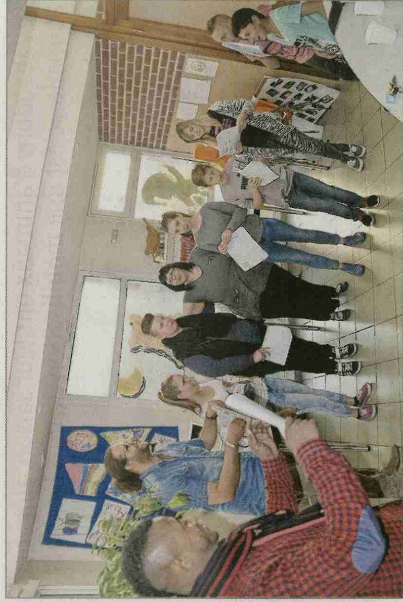
Huit jeunes rappers ont formé un groupe de choc pour un spectacle offert aux parents.