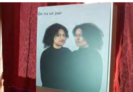
photographies prises lors des événements du Temps des débats, à La Condition Publique, à l'ARA, à la Manufacture, à la Cave aux Poètes, et à la salle Pierre de Roubaix de l'Hôtel de Ville de Roubaix